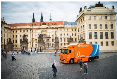
Podpis pod zdjęciem: Gebrüder Weiss chce nadal inwestować w technologie dotyczące wodoru. Należący do firmy samochód ciężarowy z napędem wodorowym pomyślnie zaliczył w 2022 r. test na długodystansowej trasie do Pragi.