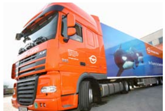
Bequemer Gütertransport dank Carnet-TIR.

Ziel des Zolltransitdokumentes ist eine wesentliche Erleichterung des internationalen Warenverkehrs bzw. eine gleichzeitige Zollsicherheit und Abgabebürgschaft zu gewährleisten. Durch ein