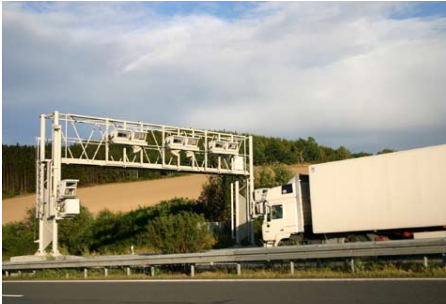
Fahrzeuge über 3,5 Tonnen benötigen nun ein Lesegerät für die vollelektronische Mautabbuchung.

Tschechien führt auf Autobahnen, Schnellstraßen und ausgewählten Straßen eine kilometerabhängige Maut auch für Fahrzeuge über 3,5 Tonnen ein.